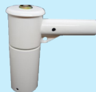
Głowica obrotowa z ramieniem banera