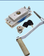
Wciągarka taśmowa (opcja)