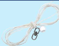
Linka (kevlar) z krętlikiem i kulką dystansową