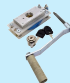
Wciągarka taśmowa (opcja)