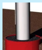
Tuleja osadcza kompozytowa Długość 70-100cm